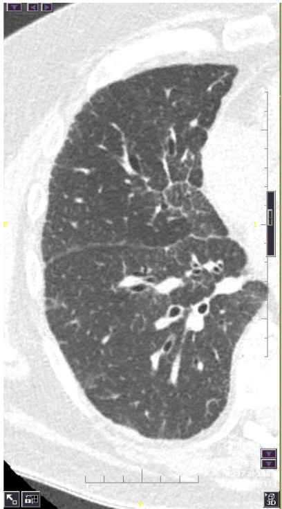
Scanner thoracique standard

Ce scanner ULD reste informatif, mais présente par rapport à un scanner standard une qualité d'image dégradée , notamment du fait d'un bruit nettement majoré .